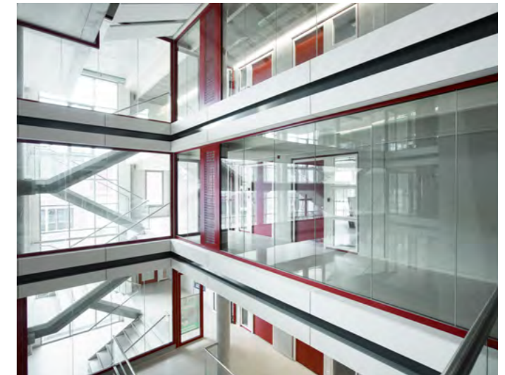
DON BOSCO | Secundaire school Sint-Pieters-Woluwe

Dankzij het modulaire karakter kunnen zeer diverse en specifieke opstellingen worden gerealiseerd die voldoen aan strenge eisen voor geluidsisolatie, geluidsabsorptie, brandveiligheid en esthetiek. Bovendien zijn ze upgradebaar, waardoor ze langer kunnen worden ingezet.